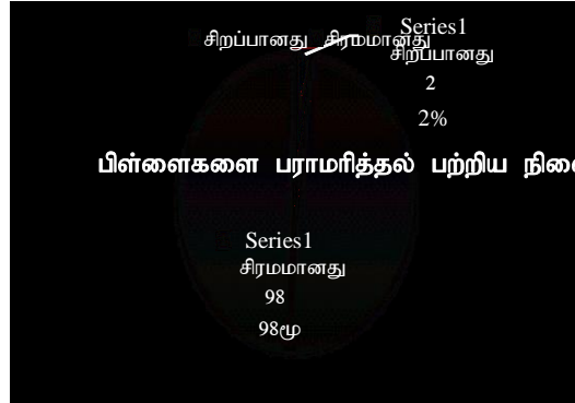
வரைபடம் 3.2 பிள்ளைகளைப் பராமரித்தல் பற்றிய நிலை

நேரடி அவதானிப்பின் மூலம் இதனைக் கண்டறிய முடிந்ததோடு “மண்சரிவிற்குப் பின்னர் உங்கள் பிள்ளைகளை பராமரிக்கும் நிலை: சிறப்பானது, முன்புபோன்றது, சிரமமானது” என்று 55 அறைகளை அடிப்படையாகக்கொண்டு வினாகொத்தின் மூலம் கேட்டபோது இரண்டு வீதமானோர் சிறப்பானது என்றும் முன்பு போன்றுள்ளது என்றும் தெரிவித்தனர். எனினும் 98 வீதமானோர் சிரமமாக உள்ளது என்றே கூறியுள்ளனர். இதனை பின்வரும் வரைபடம் 3.2 இன் மூலம் அறியலாம்.